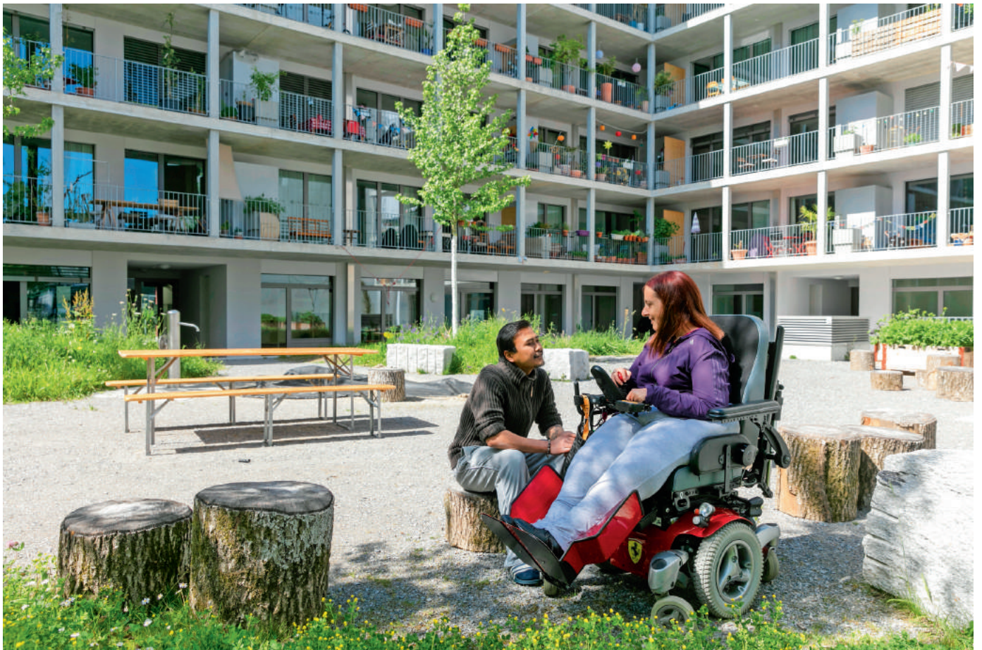
Zeit für Zweisamkeit: Feierabend im Innenhof des Kulturparks.